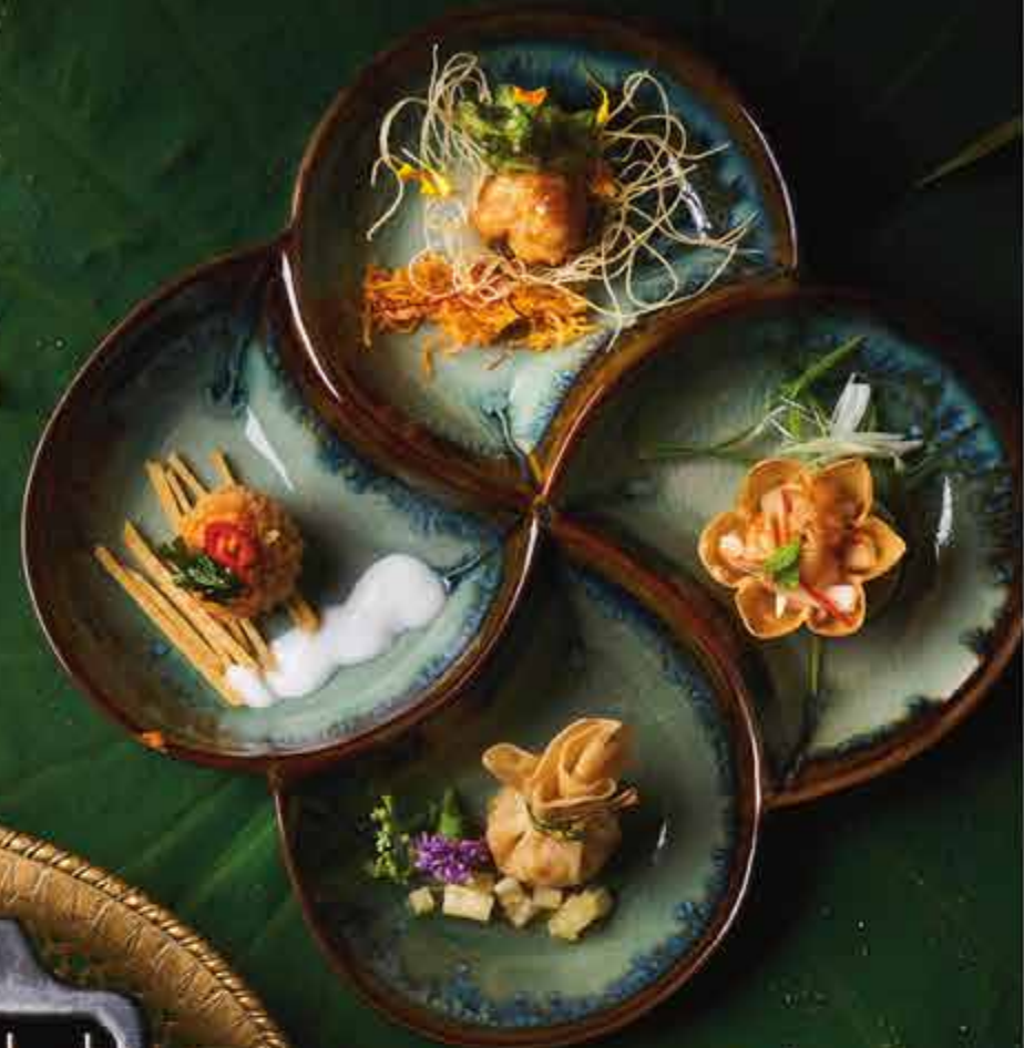
▲ KHONG THORD RUAM (P) ของทอดรวม Deep-Fried Assorted Thai Snacks of Chicken, Pork, Prawns, Scallops, Squid