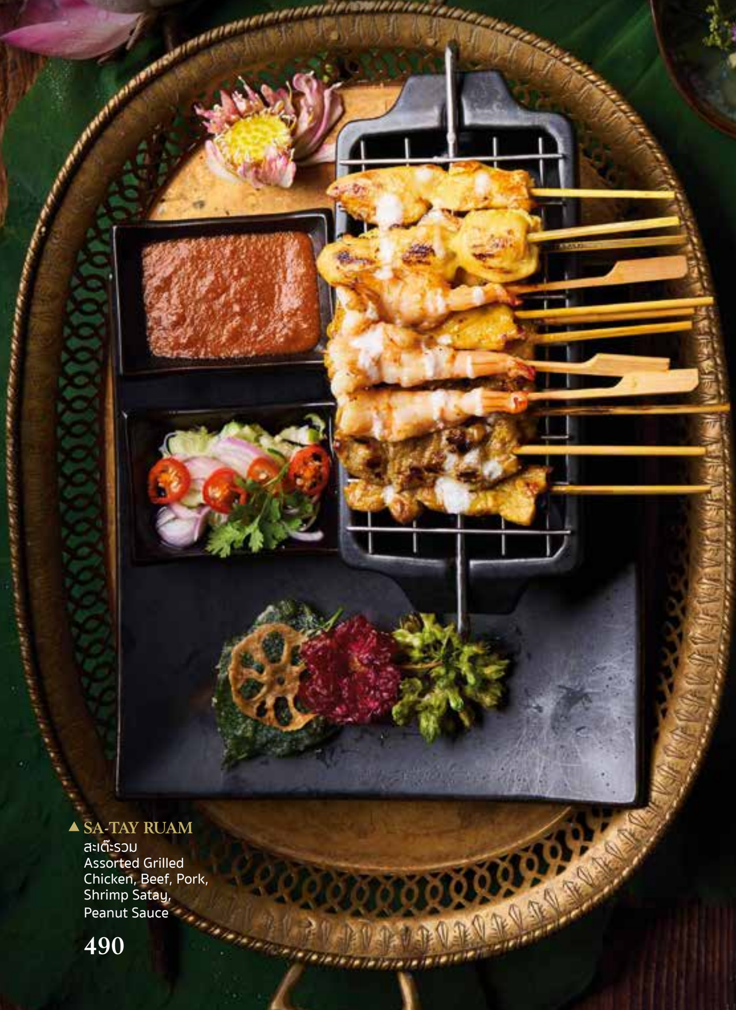
▲ SA-TAY RUAM สละเตี๋-ระจุม Assorted Grilled Chicken, Beef, Pork, Shrimp Satay, Peanut Sauce