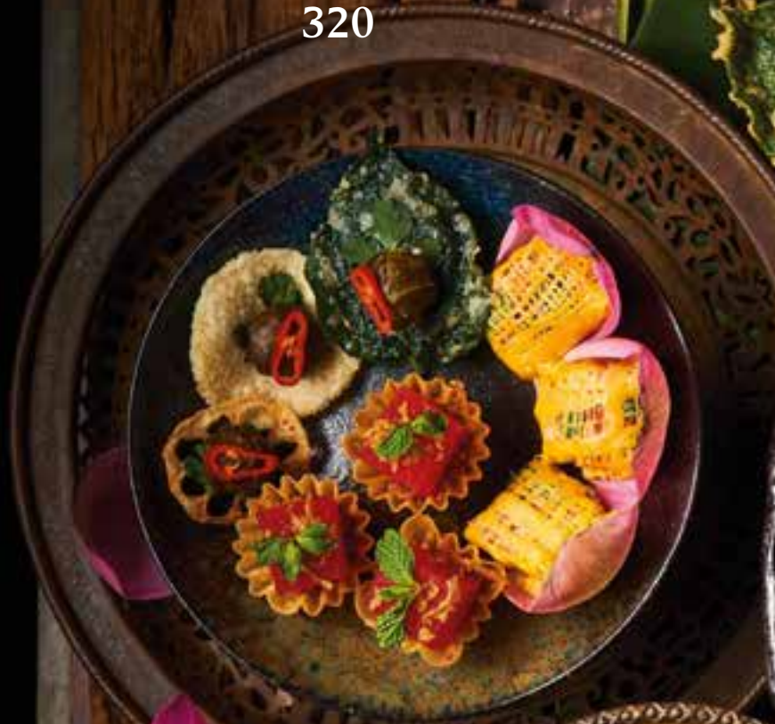
◀ THORD MUN SONG SA HAI ทอดมันสองผาไชย Deep-Fried Spicy Fish Cakes, Deep-Fried Shrimp Cakes